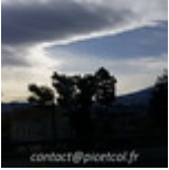
Fin16-Debut17 J02- Tokyo Mont Fujiyama 20161226_011