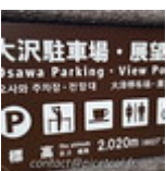
Fin16-Debut17 J02- Tokyo Mont Fujiyama 20161226_034