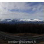
Fin16-Debut17 J02- Tokyo Mont Fujiyama 20161226_033