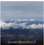
Fin16-Debut17 J02- Tokyo Mont Fujiyama 20161226_028