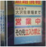
Fin16-Debut17 J02- Tokyo Mont Fujiyama 20161226_026