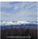
Fin16-Debut17 J02- Tokyo Mont Fujiyama 20161226_031