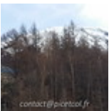
Fin16-Debut17 J02- Tokyo Mont Fujiyama 20161226_030