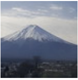
Fin16-Debut17 J02- Tokyo Mont Fujiyama 20161226_020