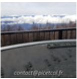
Fin16-Debut17 J02- Tokyo Mont Fujiyama 20161226_027